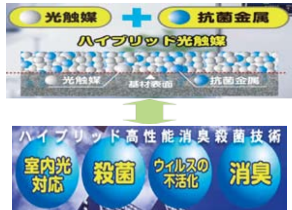
図 2. MaSSC の特徴

光触媒・抗菌金属のハイブリッド溶射により高殺菌・高分解・高消臭性能を実現しました。