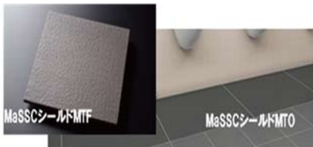
図 1. 商品ラインアップ