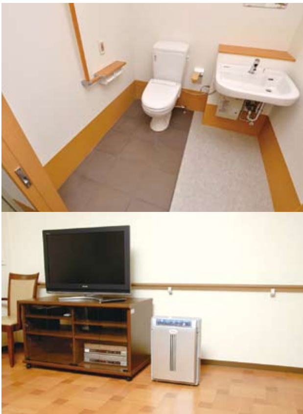
図6. 某介護施設のトイレと談話室