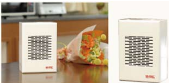
空気消臭殺菌装置 MaSSCクリーン MC-V