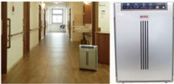
空気消臭殺菌装置 MaSSCクリーン MC-P

MaSSC とは、高性能のハイブリッド光触媒を弊社独自の溶射技術により被膜化し、その結果、高い殺菌を發揮する材料という意味を表します。販売商材のカテゴリーにおいては、MaSSC シールドタイル（消臭殺菌タイル）、MaSSC クリーン（空気消臭殺菌装置）をラインアップしています。