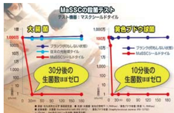
図 4. MaSSC の機能②