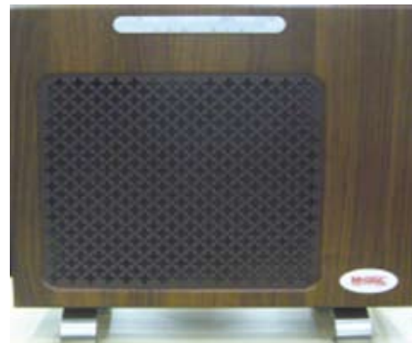
図7. 中型空気消臭殺菌装置 MC-M

空気消臭殺菌装置においては、高齢者施設や病院において可搬式の仕様に加えて壁掛け式のニーズがあり新たに壁掛け兼用(図7)の商品開発を進めております。また、タイルについては従来の硬質タイルに加え軟質材タイル(図8)の商品開発に成功致しました。このように現在進行形で様々なニーズへの商品展開から問題解決へ日々邁進していく所存です。