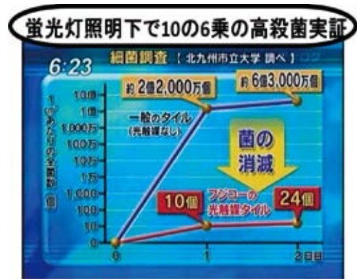
図 3. MaSSC の機能① (北九州モノレール平和通駅：実証結果)