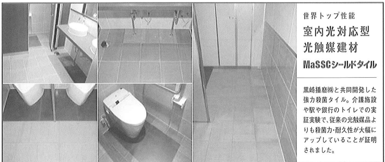
図 2. MaSSC シールドの例