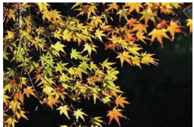
図1 逆光で浮かび上がった紅葉の真髄（美）

特に逆光の写真では、逆光に照らされて初めて被写体の良さ（真髄）が見えてくる。しかも普段とは全く異なる姿が見え、毎回新しい発見をしているようで、私は逆光の写真が好きだ。